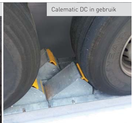
Calematic DC in gebruik