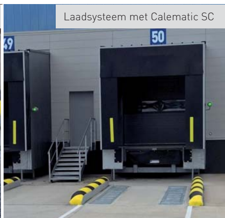
Laadsysteem met Calematic SC